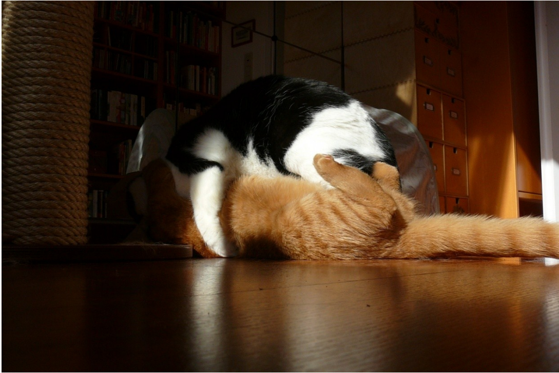
Was heißt hier „Der spinnt?“ Eine Maus von Krawinkel! Von meinem Freund Krawinkel!