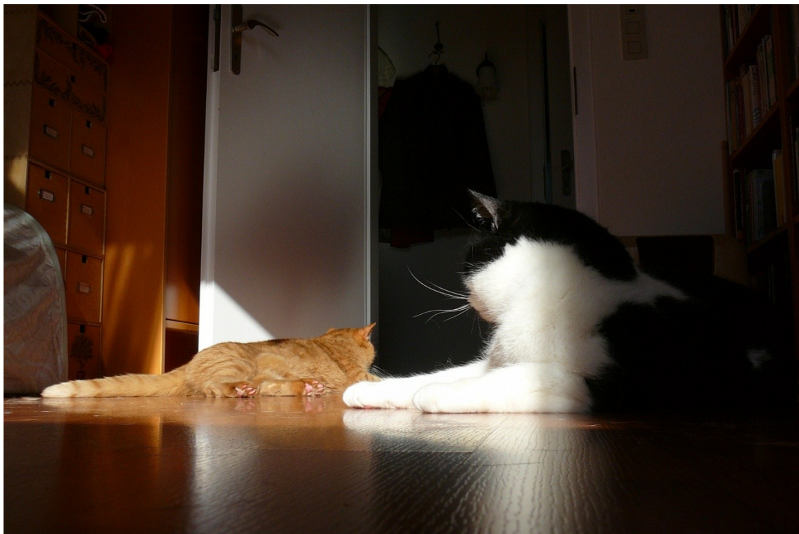
Katzen sind soooo doof!