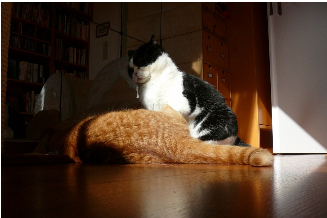
Blöde rote Katze!