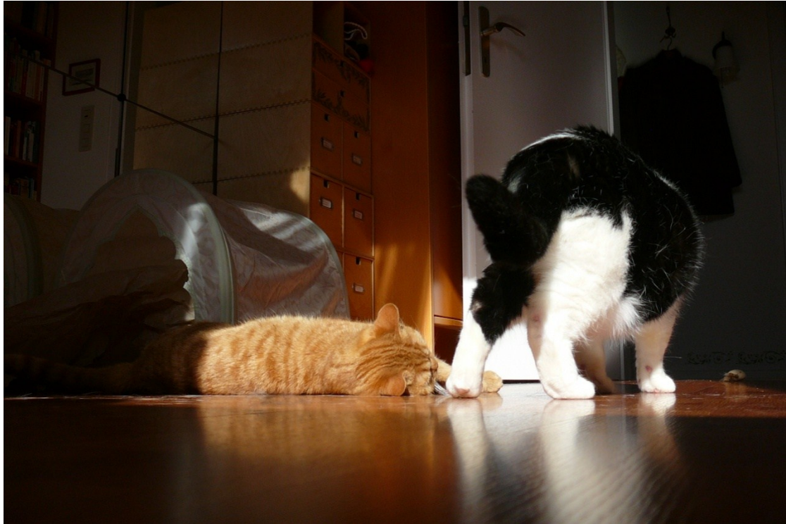
Katzen sind doof!