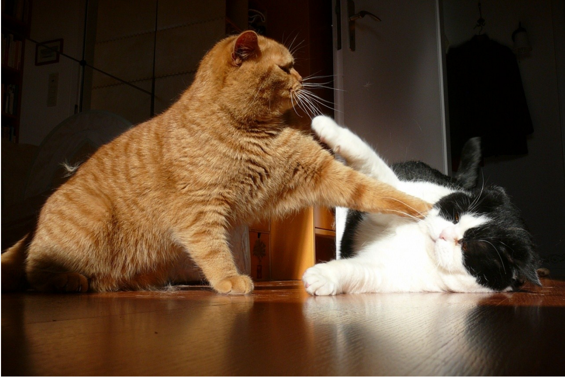
Der mit seinem Kumpel Krawinkel! Das ist zum Mäusemelken!