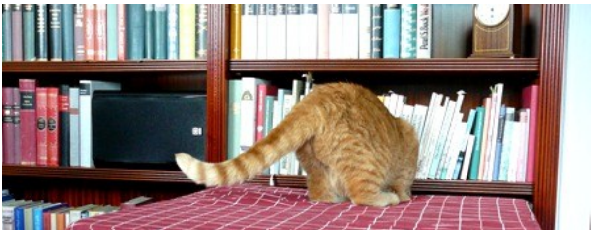
Und der Futtertupper? Der Futtertupper auch? Wie der aufgeht? Ja?