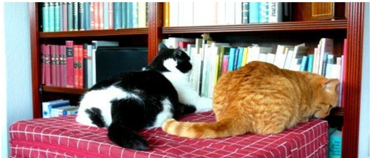
Till Eulenspiegel. Andersens Märchen. Griechische Sagen! Stell dir vor, griechische Sagen!