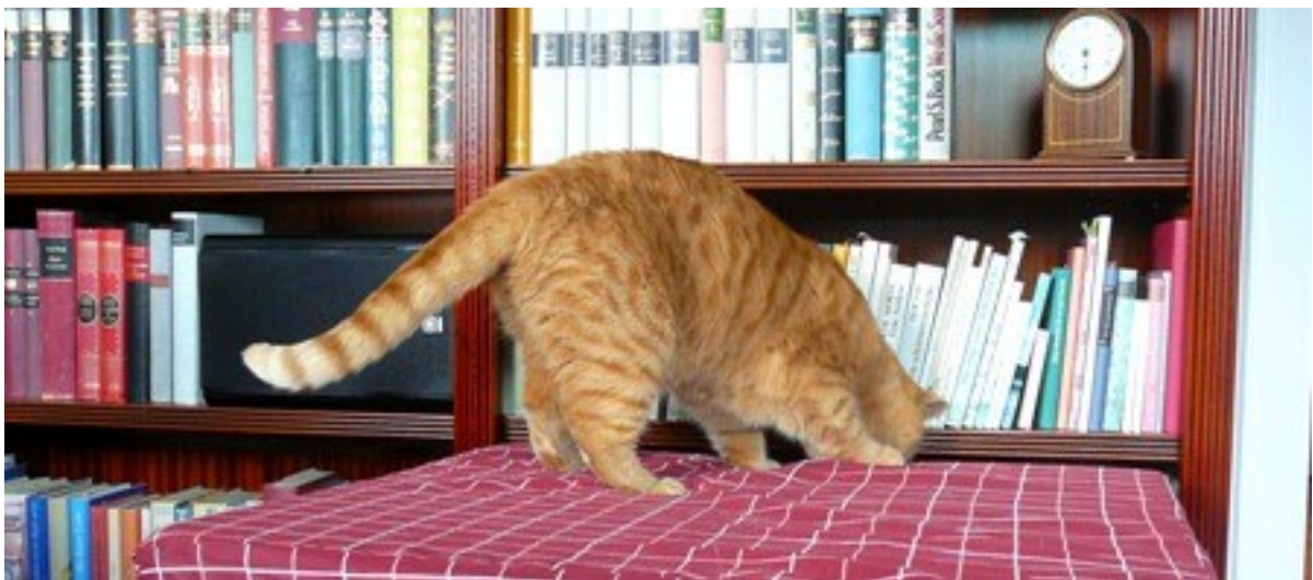
Da steht drin, wie der Kühlschrank aufgeht? Santa Claude!