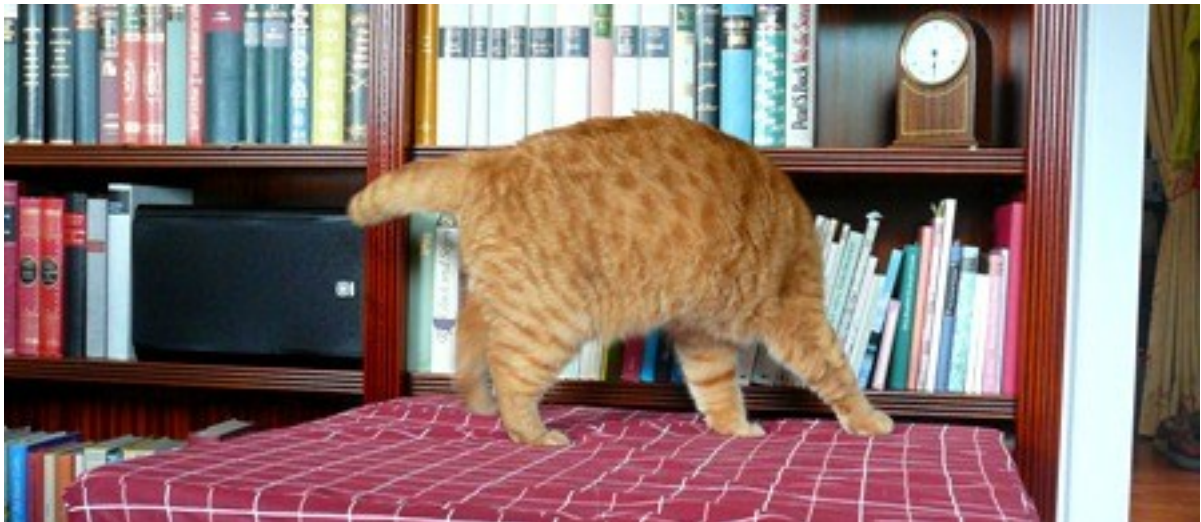
Ein „Handbuch für Katzen“? Wie katze den Kühlschrank aufbekommt? Ich werd verrückt!