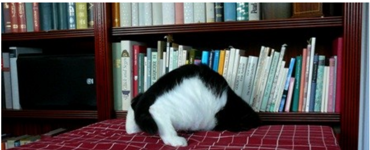
Eine Tüte mit Käserollis!