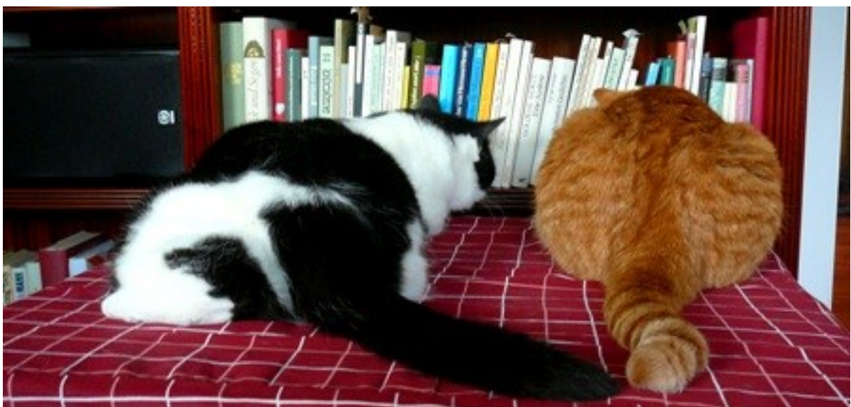
Da unten steht Ecki von Hirschhausen. „Die Leber wächst mit ihren Aufgaben“. – Cool. Und da! Guck mal! Da stehe ich. „Der Chaoskater“! Band zwei. – Band zwei? Wow! Und das „Handbuch für Katzen“. Wie katze den Kühlschrank aufbekommt.