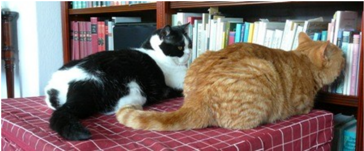
Hier steht was von Goethe! Wow, Goethe! Und Schiller! Paradox ist, wenn ein Goethedenkmal durch die Bäume schillert.