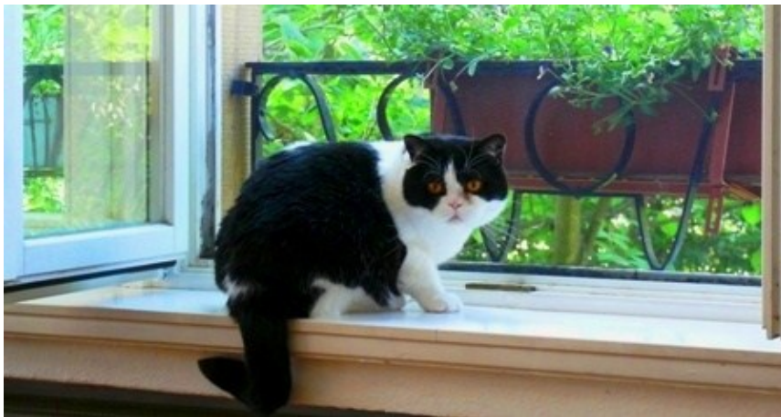
Morgen. Morgen packe ich sie! Ganz bestimmt!