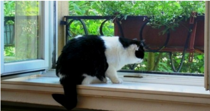
Sie ist weg. Hölle und Verdammnis, sie ist weg!