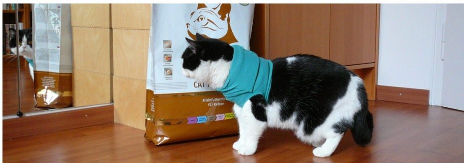
Kaninchen mit Kartoffeln! 10 Kilo! Wow!