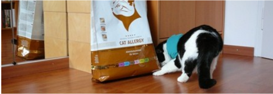
10 Kilo! Ich werd verrückt!