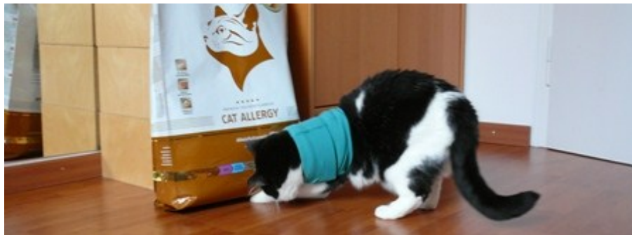
Und wo geht der Sack jetzt auf?