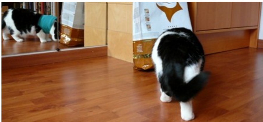
Kaninchen mit Kartoffeln?