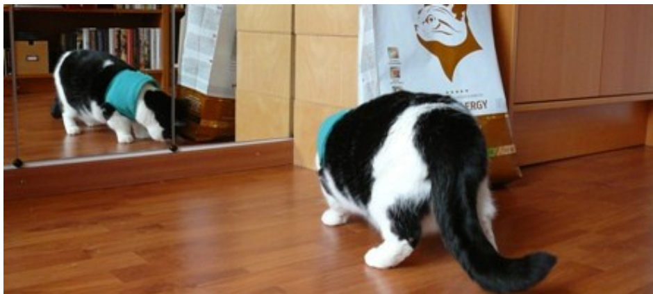
Echt? Und ganz frisch?