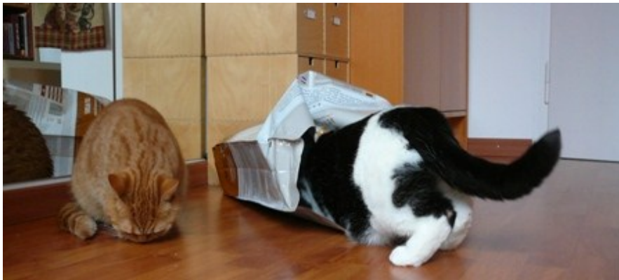
Kaninchen mit Kartoffeln. Kein Lachs mit Reis, aber in der Not...