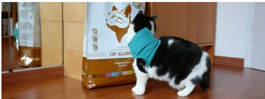
Hey, wo geht der Sack auf?