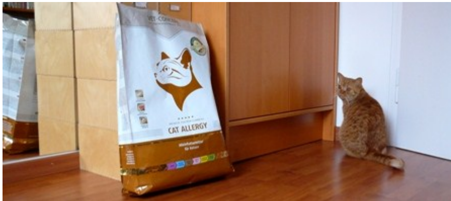
Halleluja, Petconcept hat geliefert. Kaninchen mit Kartoffeln.