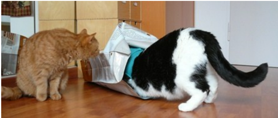
Hey, der Sack ist auf! Cool!