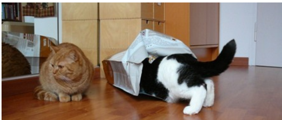
... frißt der Teufel ja bekanntlich Fliegen.