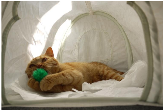
Flügelflitzer Klose-Podalska stürmt vor. Blutgrätsche von Schwarzweiß.