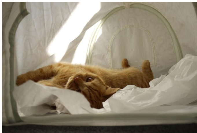
... Sanitärer! Foul!