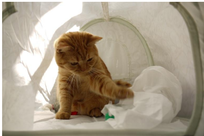
Der Ball hat immer die beste Kondition.