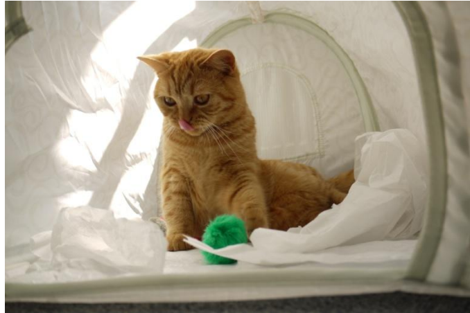
Rotblond Bissenbühl gegen Schwarzweiß Krähenwinkel.