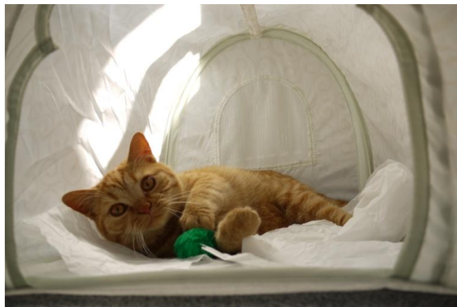
Amelie Klose-Podalska am Ball. Bananenflanke!