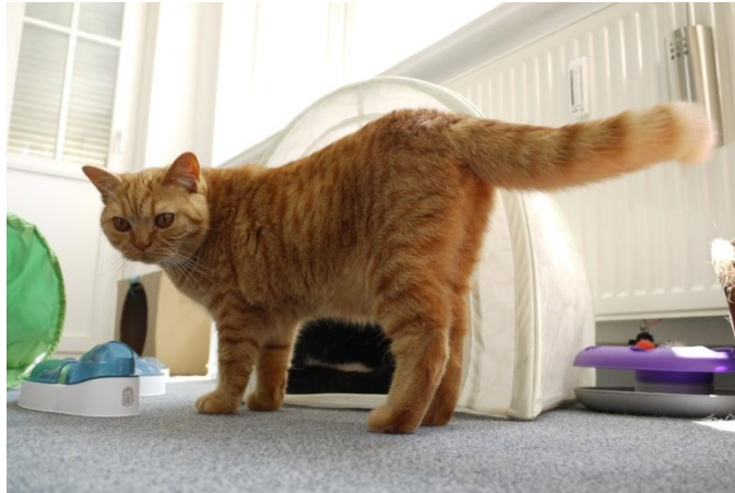
Auf dem Platz unter der kalten Weide ...