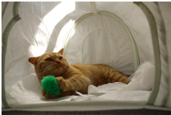
Klose-Podalska wehrt Angriff von Schwarzweiß ab. Dropkick.