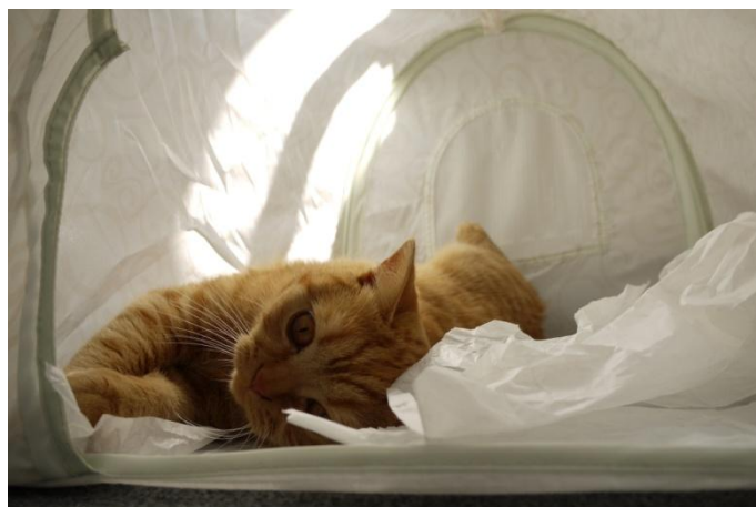
Klose-Podalska verletzt? Schiri! Foul!!!!