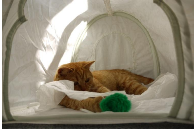
Das Runde muß ins Eckige.