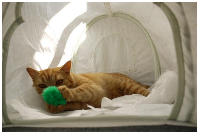
Gurkenpass von Schwarzweiß Krähenwinkel, Hammerschuss Klose-Podalska