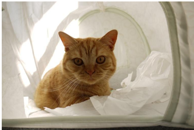
... trifft sich Katze in der Endrunde zum entscheidenden Mätsch.