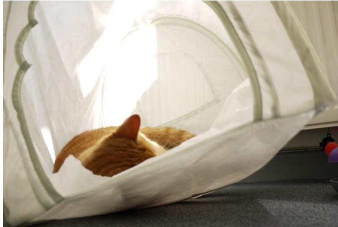
... Hackentrick von Schwarzweiß, Klose-Podalska stürzt...