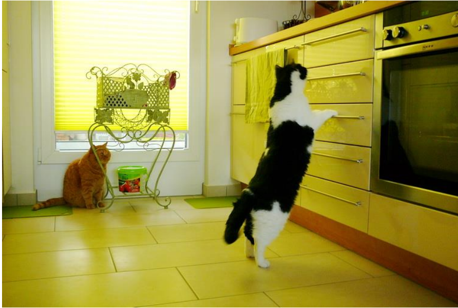
Biene habe ich ein Foto von mir geschickt. Stattlicher Kater, fünf Jahre alt, 5,3 Kilos, sportlich durchtrainiert ...