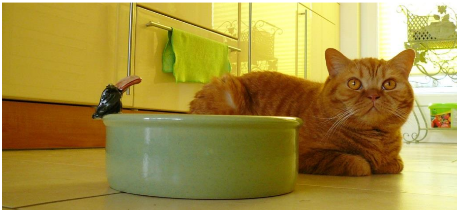
Du bist doch keine fünf mehr! Und durchtrainiert ... Na, ich weiß nicht!